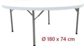
MESA REDONDA PLEGABLE ST-180