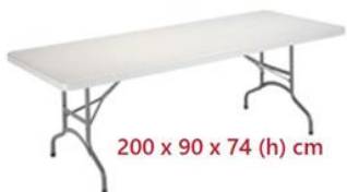
MESA RECTANGULAR PLEGABLE ST-20 (ancho especial)