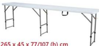
MOSTRADOR PLEGABLE ST19

265 x 45 x 77/107 (h) cm altura regulable 2 posiciones