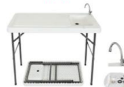
FREGADERO PLEGABLE ST-30