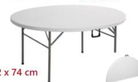
MESA REDONDA MALETA PLEGABLE ST-120-P