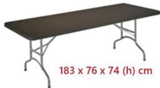
MESA RECTANGULAR PLEGABLE NEGRA ST-4-N