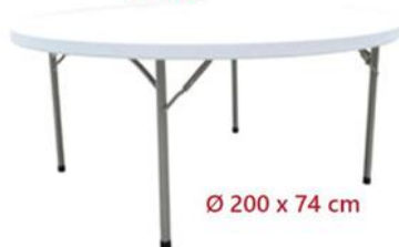
MESA REDONDA PLEGABLE ST-200