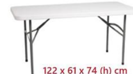
MESA RECTANGULAR PLEGABLE ST-40