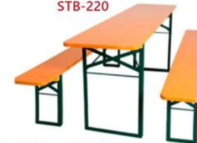
MESA Y BANCOS PLEGABLES STB-220

Bancos plegables 220 x 25 cm Mesa 220 x 50 cm Mesa 220 x 67 cm Mesa 220 x 80 cm