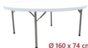
MESA REDONDA PLEGABLE ST-160