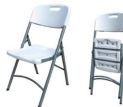
SILLA PLEGABLE SC-12