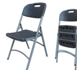
SILLA PLEGABLE SC-12-N