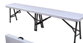
BANCO PLEGABLE SC-13