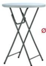
MESA ALTA PLEGABLE ST-6