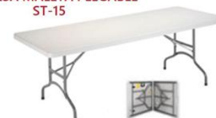
MESA MALETA PLEGABLE ST-15