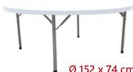
MESA REDONDA PLEGABLE ST-150