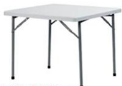
MESA CUADRADA PLEGABLE ST-14