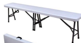
BANCO PLEGABLE SC-11

265 x 45 x 77/107 (h) cm altura regulable 2 posiciones