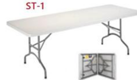
MESA MALETA PLEGABLE ST-1