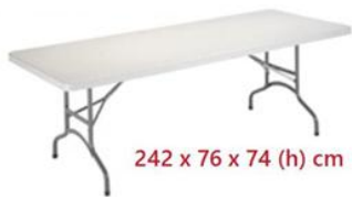
MESA RECTANGULAR PLEGABLE ST-16